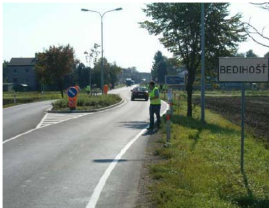
Obr. 5 – Vjezdový ostrůvek do obce (Bedihošť)