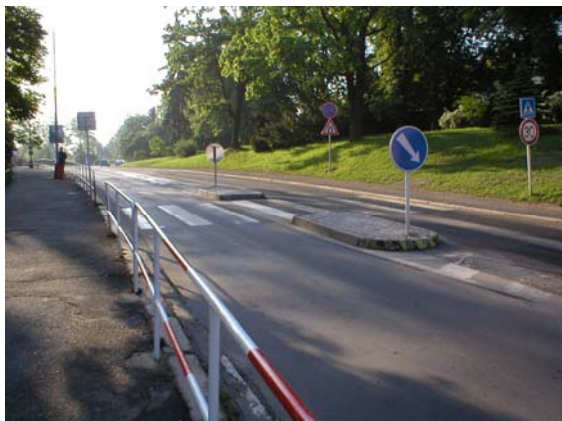
Obr. 1 – Přechod pro chodce se středním dělicím ostrůvkem (Mělník – Tyršova)