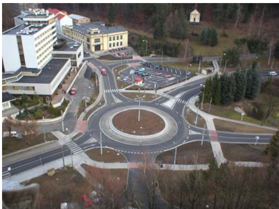
Obr. 7 – Okružní křižovatka (Jáchymov)