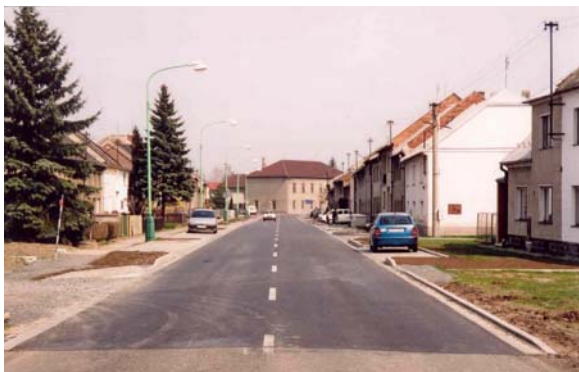
Obrázek 9: Příklad průtahu obcí (Rajhrad)