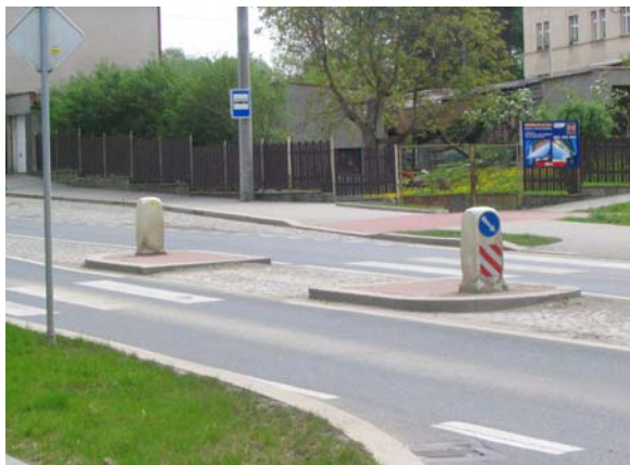
Obrázek 5: Příklad středního dělicího ostrůvku (Dobřany)