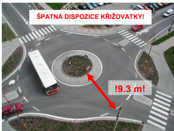
Obrázek 1: Příklad naddimenzované šířky okružního pásu, kdy šířka pojižděného prstence a šířka okružního pásu dávají dohromady zbytečně 9,3 m (Blansko).