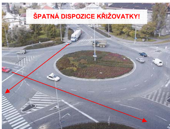
Obrázek 2: Při návrhu okružní křižovatky je nutné zabránit tangenciálním průjezdům (Kolín)