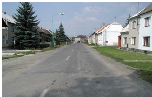
Obrázek 10: Jak průtah nemá vypadat (Rajhrad – před úpravou)