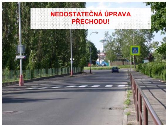
Obrázek 6: Příklad špatného řešení přechodu pro chodce (dlouhý přímý úsek řidiče svádí k vyšším rychlostem)