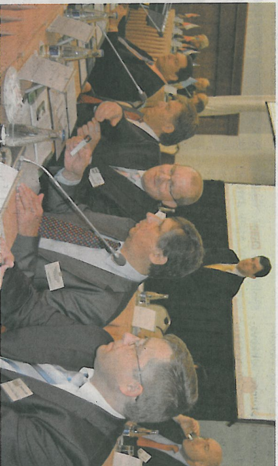
Předsednický stůl na IV. Národním setkání starostů, primátorů a hejtmánů 16. června 2009 v Praze

pochválil starosty, že obce a města jsou lepší hospodáři. Za dosavadní práci pochválil města a obce, kterým se podle Fischera podařilo zlepšit hospodaření s financemi. Starostové se zlobí na poslance za špatné hospodaření státu. Obrovské deficity a dluhy státního rozpočtu jsou zločinem poslanců a předchozích vládních občanů a měst. Obce mají sice také dluhy, ale dluhy neprožívají jako stát a peníze investují. Dluhy obcí v roce 2008 byly celkem 80 mld. Kč, ale zůstatky na účtech měst a obcí byly vyšší, protože obce šetří na investice. Obce investují průměrně 1/3 veškerých svých příjmů, státní rozpočet nemá ani na běžné výdaje a jeho investice jsou každý rok podstatně nižší než dluhy. Jan Fischer sdělil, že by se nebránil ani převodu dotací z rukou úředníků úřadů do rukou obcí a měst, ale označil to za politickou otázku, kterou jeho kabinet nemůže řešit. Pan premiér Jan Fischer doslova uvedl: „Odpověď na otázku, jak má být toto přerzdělování velké, si dovoluji přenacházet na zástupcích politických stran. Pouze si se zapojením znalostí z mé původní profese dovoluji poznamenat, že míra transparentnosti a spravedlnosti tohoto