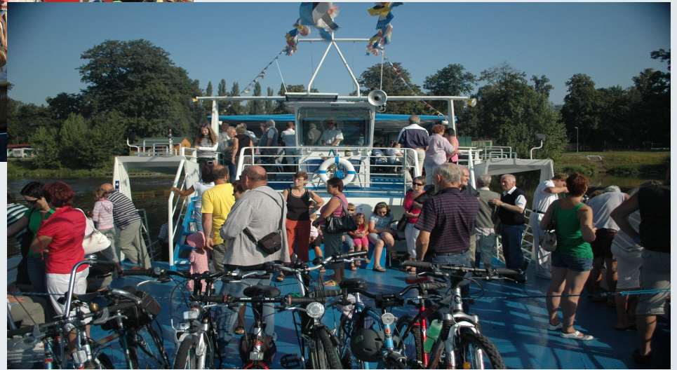
Litoměřicko a cestovní ruch 2009 až 2010