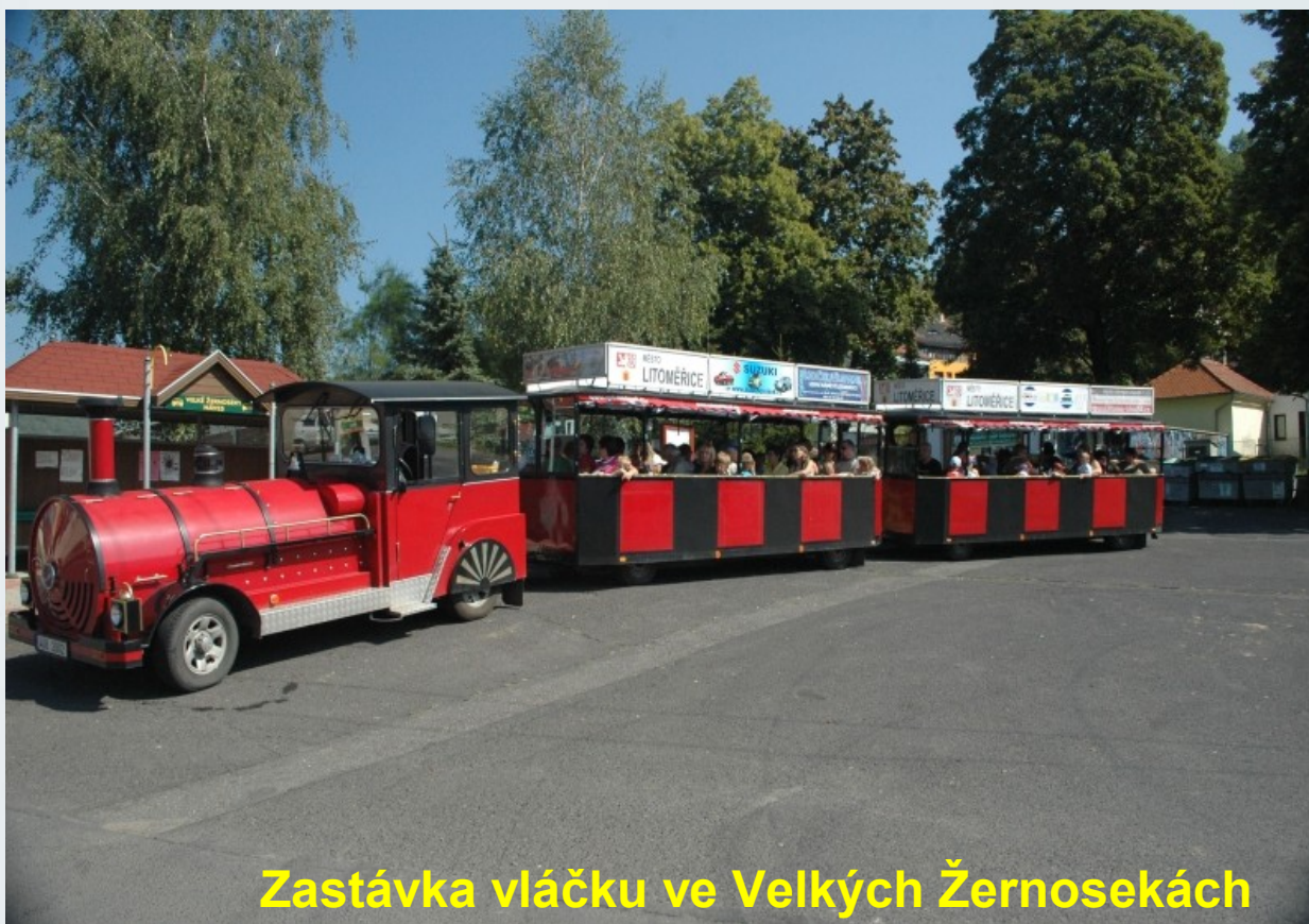
Zastávka vláčku ve Velkých Žernosekách

Litoměřicko a cestovní ruch 2009 až 2010