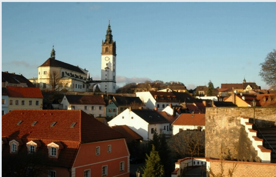
Centrum cestovního ruchu Litoměřice, p.o.