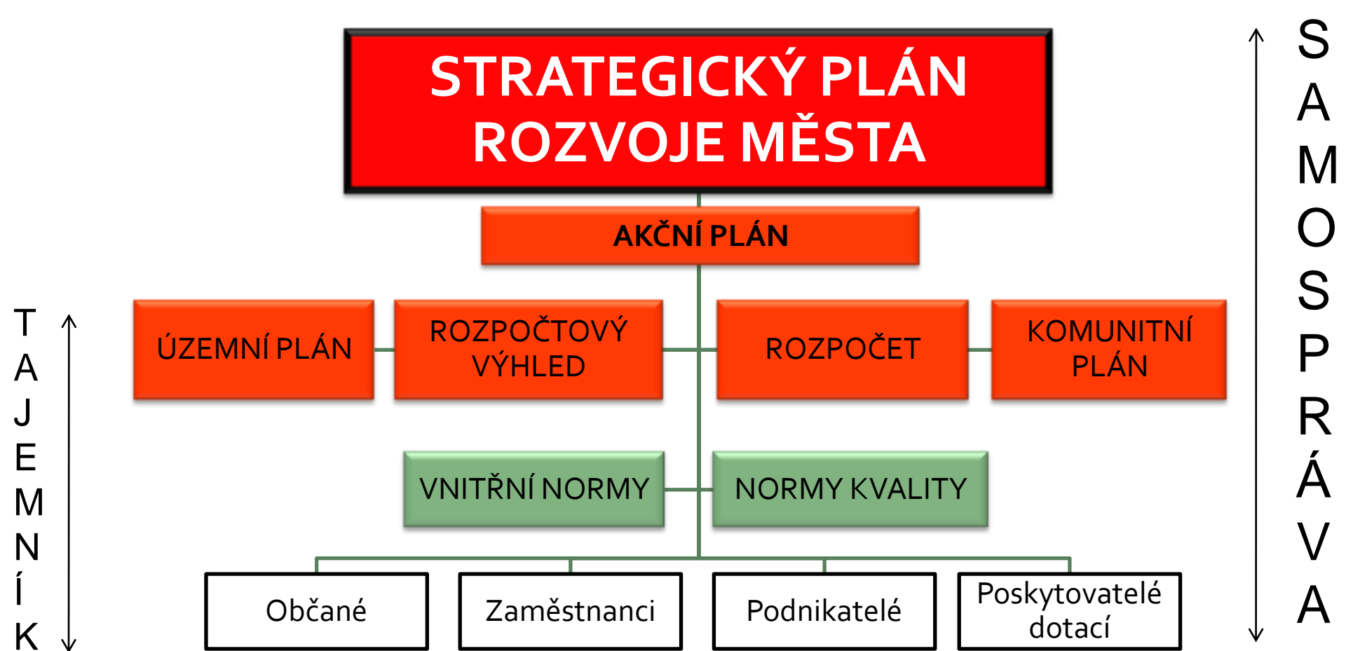
Schéma řídicí dokumentace města

Stanovení cílů a strategií podstatně ovlivňuje možnosti a úspěch samosprávy