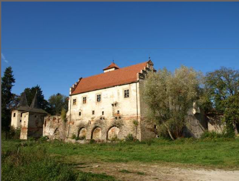
Červená Řečice, okr. Pelhřimov Záchrana zámku, jehož vlastník je bytové družstvo v likvidaci (PZAD)