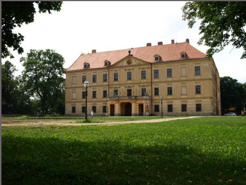
Jemnice, okr. Třebíč Obnova z PZAD směřující k zpřístupnění zámku veřejnosti