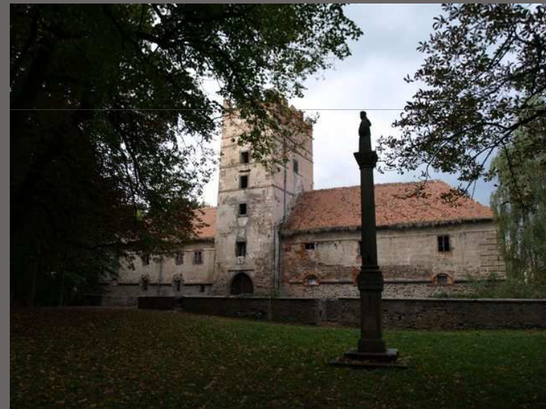
Brtnice, okr. Jihlava Záchrana zámku s nevyjasněnými vlastnickými vztahy (PZAD)