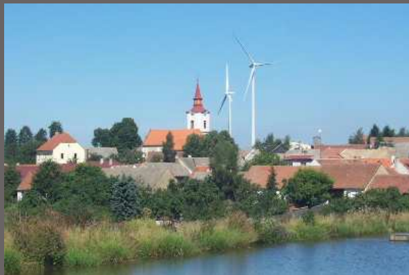
Pavlov, okr. Jihlava Realizace větrných elektráren v bezprostřední blízkosti obce