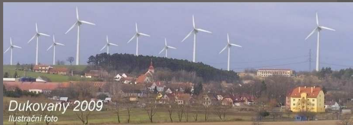
Dukovany 2009 Ilustrační foto Dukovany, okr. Třebíč Studie záměru výstavby větrných elektráren na v blízkosti obce