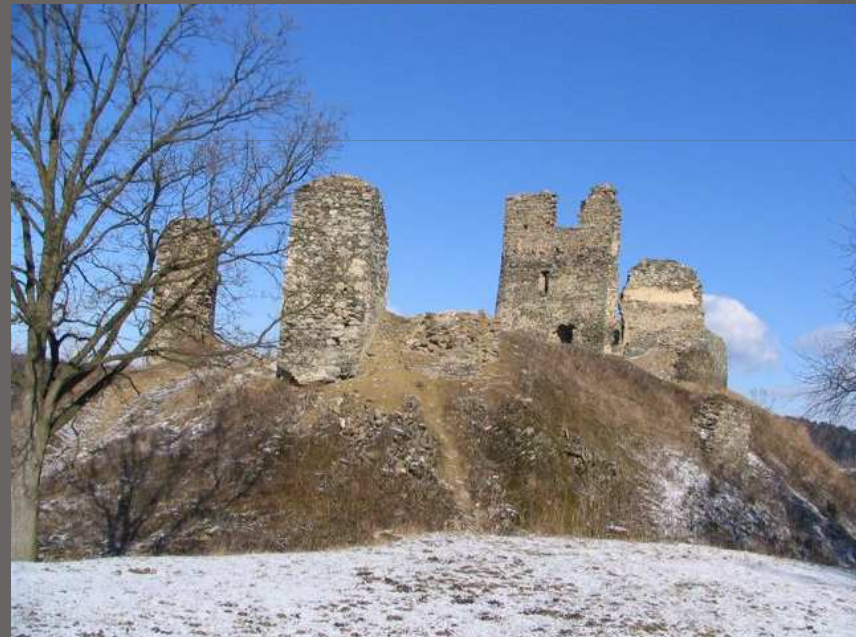
Brníčko, okr. Šumperk Odborná konzervace hradní zříceniny