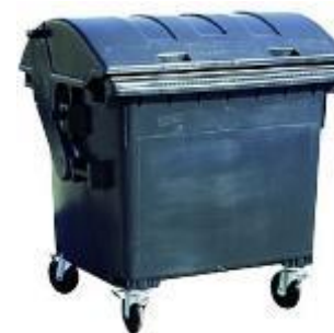
Efektivní svoz odpadů