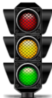
Propojené řízení dopravy