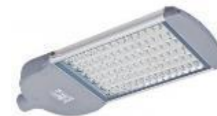
Městské osvětlení reagující na konkrétní situaci

Obecní automatizační platforma – nechť se systémy vzájemně ovlivňují a komunikují