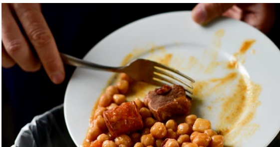
Snížení plýtvání potravinami