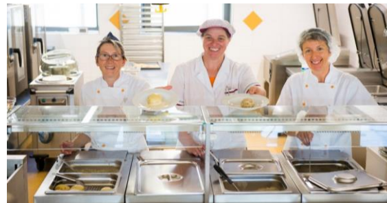
Bezpečnost a hygiena