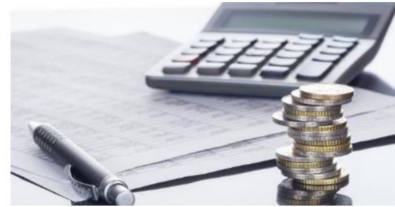
Investiční a provozní náklady