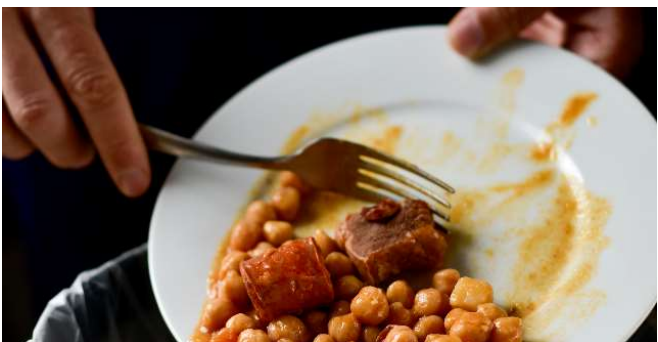
Snížení plýtvání potravinami