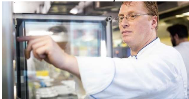
Standardizace a nedostatek kvalifikovaných pracovníků