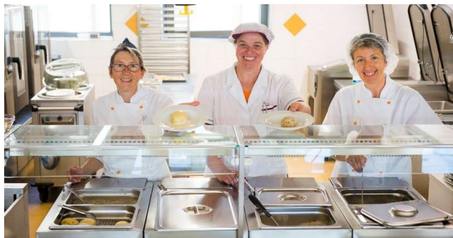
Bezpečnost a hygiena