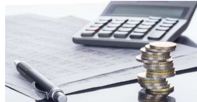
Investiční a provozní náklady