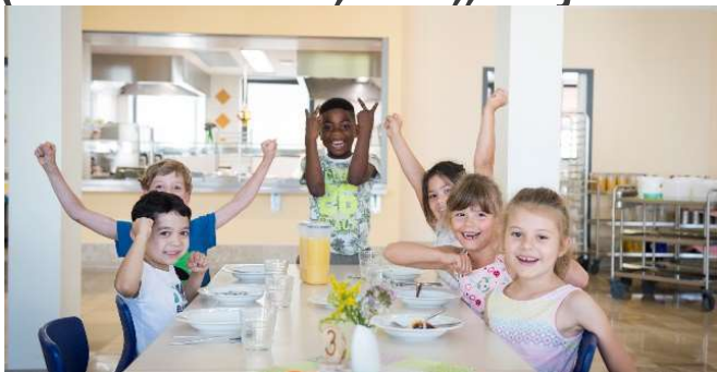
Rostoucí nároky: Zdravá výživa a rozmanitost

Feedback od našich zákazníků – co Vás zajímá a trápí? (ale také to, že „nejsou lidi“ i kvůli malým tabulkovým platům)