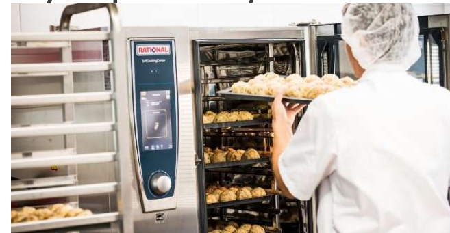
Efektivní a udržitelná výroba